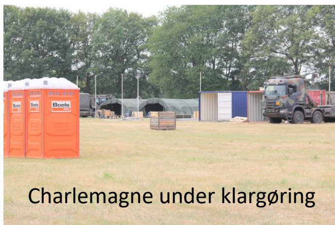
Charlemagne under klargøring

Morgendagens rute går gennem terrænet syd for Nijmegen gennem: Grave, Beers, Cuijk, Mook, Malden og ind på afsluttende rasteplass Charlemagne. Herefter de sidste godt og vel 5 km ind gennem Nijmegen – 167,2 km er hermed tilbagelagt.