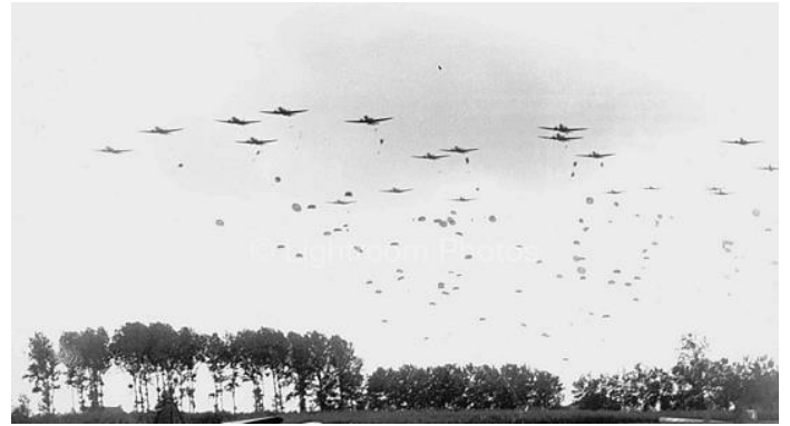
Luftbårent infanteri fra 82. Airborne Division, "All Americans" springer ud nær Grave i 17. september 1944.